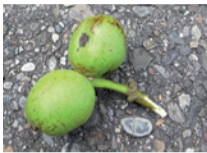
Frucht der Schwarznuss.

Die Schwarznuss ist nah verwandt mit dem Walnussbaum Juglans regia . Sie wird häufig in Parks gepflanzt, eignet sich aber nicht als Strassenbaum. Beide Nussbaumarten produzieren den dunkelbraunen Farbstoff Juglon. Juglon ist giftig und hemmt andere Pflanzen beim Wachsen. Zudem kann Juglon für Tiere tödlich wirken. Um Mäuse abzuwehren, wird der Nussbaum gerne in die Nähe von Fruchtbäumen gepflanzt. In Nordamerika, dem Herkunftsland der Schwarznuss, wird sie als Nutzpflanze angebaut. Die Nüsse werden geerntet und aus dem dekorativen Holz lassen sich Möbel herstellen.