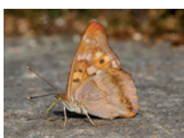
Die Raupe des einheimischen Kleinen Schillerfalters ernährt sich von Pappelblättern.

Die Zitterpappel, auch Espe genannt, ist einheimisch. Sie ist eine der wichtigsten Futterpflanzen für viele europäische Schmetterlinge und deren Raupen. Damit spielt sie eine wichtige Rolle bei der Förderung der Biodiversität. Das gelbe Herbstlaub ist sehr dekorativ. Zudem ist sie tolerant gegenüber Trockenheit, Frost und Hitze. Aus diesen Gründen wird sie sich auch in Zukunft sehr gut als Stadtbaum eignen. Die Espe wächst in den ersten Jahren schnell, wird aber höchstens 100 Jahre alt.