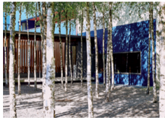
Innenhof des Hotels Greulich.

Gut versteckt im Hof des Hotels Greulich gedeiht ein Birkenhain. Die 160 Bäume standen 2002 an der Expo in Murten und wurden später nach Zürich gebracht. 85 Birken wachsen im Innenhof (nicht zugänglich) und die restlichen begrünen die Parkplätze (zugänglich). Solche engen Gruppenpflanzungen von Bäumen, sogenannte Clumps, sind eine Neuinterpretation eines beliebten Elements englischer Landschaftspärke. In der Landschaftsarchitektur wird es genutzt, obwohl sich die Bäume dadurch stark konkurrieren und nicht alle alt werden können.