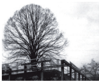
Stützmauern zum Schutz während des Baus.

Während des Baus wurde der Wurzelbereich mit speziellen Stützmauern geschützt. Die Bemühungen haben sich gelohnt. Durch das Grün, den Schatten im Sommer und die Herbstfärbung erhöht die Linde die Lebensqualität für die Bewohnenden und ist für Tiere Lebensraum und Futterplatz in einem.