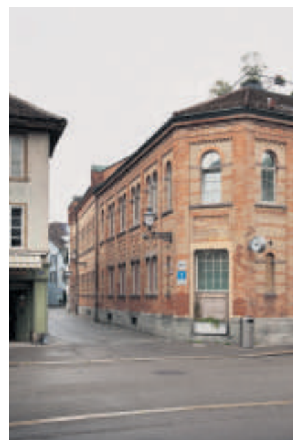
Erstes Schweizer Hallenbad.

In ihrer Blütezeit pendelte das Treiben in der «Moschee» zwischen Alltag und Noblesse, wie dem unerschöpflichen Winterthurer Glossar von Heinz Bächinger und Urs Widmer zu entnehmen ist. Seife gab es im 19. Jahrhundert schon, aber saubere Winterthurer brauchten auch Wannenbäder und Duschen; in Altstadtwohnungen suchte man derart Modernes vergeblich. Das Schwimmbecken an der Badgasse wies keine olympiatauglichen Masse auf. Die Anlage wurde aber in Anlehnung an die