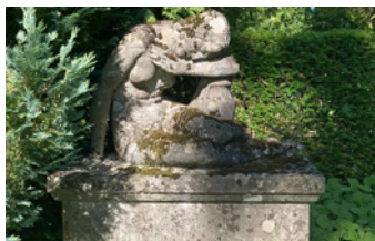
Familien-Mietgrab mit historischem Grabmal