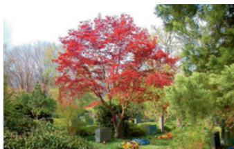
Familien-Mietgrab Erdbestattung / Urnenbeisetzung