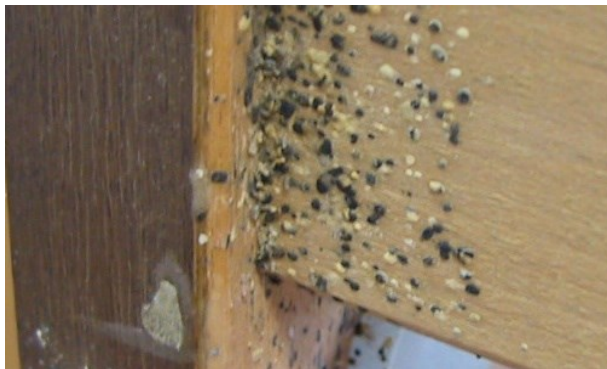
پێسایه‌ی میرووی پێخه‌ف له‌سه‌ر ته‌خته‌ی سیسه‌میک که‌ به‌ توندی توشی میرووی پێخه‌ف بووه‌.

وتنه‌: شاری زوریخ، پاراستنی ته‌ندروستی و ژینگه