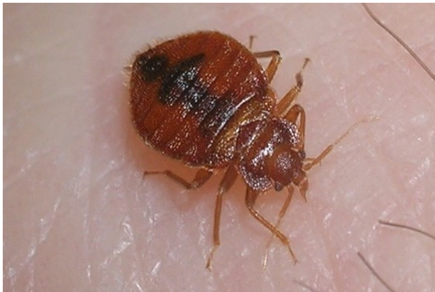
Punaise de lit adulte pendant son repas sanguin.