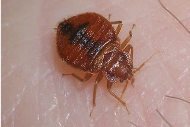
পূর্ণবয়সী ছারপোকা রক্ত খায়।