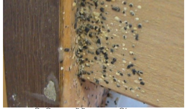
অত্যন্ত সংক্রামিত বিছানার স্ল্যাটে উপর ছারপোকা বিষ্ঠা দেখতে পাওয়া যায়।