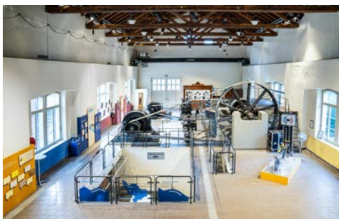
Blick in den Maschinensaal mit der versenkten Turbine im vorderen Bereich und den historischen Installationen im Hintergrund.

Nach mehrmonatigem Umbau hat das Kraftwerk Höngg Anfang Dezember wieder seine Tore für Besichtigungen geöffnet. Auf einer raumgrossen, interaktiven Wand wird das Zusammenspiel von erneuerbaren Energien und deren Bedeutung für die Stadt Zürich spielerisch vermittelt. Im Zentrum der Ausstellung steht die Wasserkraft, ihre Geschichte ebenso wie die Technik: Seit wann wird mit Wasser Strom produziert? Wie funktioniert eine Turbine? Sind Wasserkraft und Naturschutz miteinander vereinbar? Diese Fragen werden mittels Hologramm, Filmen, Installationen und Informationstafeln publikumsnah beantwortet. Zudem wird aufgezeigt, wie gross der Beitrag des ewz zur Erreichung des städtischen Netto-Null-Ziels ist und welche grösseren und kleineren Energiesparmöglichkeiten es im Alltag gibt.