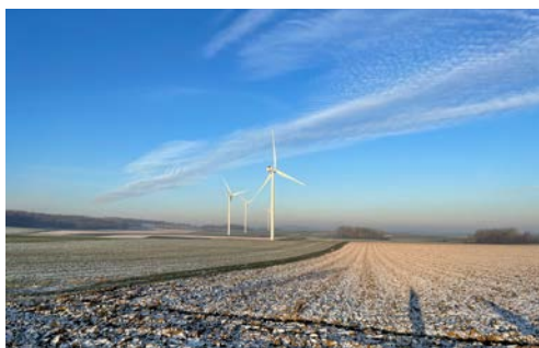
Der Windpark Camblain (4 Turbinen, 12 MW) ging als erster aus dem Paket mit Ostwind im März 2022 in Betrieb. (Bild: ewz)

Seit 2020 entwickelte das ewz zusammen mit Ostwind International SAS (Ostwind) zehn Windparkprojekte (aufgeteilt auf 16 Projektgesellschaften) in Frankreich. Aus strategischen Gründen hat sich Ostwind für einen Verkauf seiner Anteile an diesen gemeinsamen Projekten entschieden. Im Berichtsjahr konnte ewz die Projektgesellschaften vollständig übernehmen und somit seine Ausbauziele im französischen Windmarkt weiterführen. Geplant sind 10 Windparks mit 69 Turbinen und einer Gesamtleistung von etwa 173 MW. Sie werden voraussichtlich ab 2028 rund 450 GWh Strom produzieren. Bis 2022 konnten 4 Projekte realisiert werden.