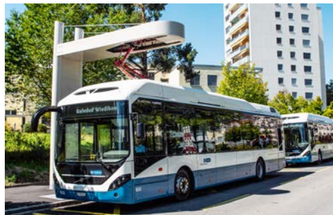
Ladestation für eHybrid-Standardbusse an der Haltestelle Dunkelhölzli.

Weitere Informationen zur Elektrobustategie der VBZ unter vbz.ch/ebus