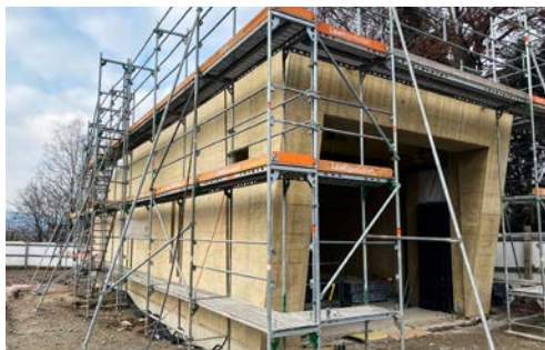
Ansicht des unfertigen Eingangsbereiches des Pumpwerkes Schindlergut.